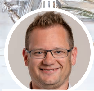
GV FRANZ DINHOF