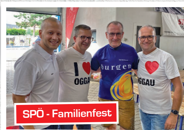
SPÖ - Familienfest

Landeshauptmann-Stellvertreterin und SPÖ-Bezirksparteivorsitzende