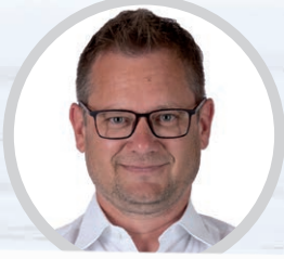
GV FRANZ DINHOF